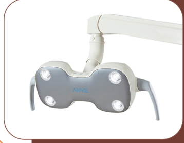
LED OPERATING LIGHT

مصدر ضوء LED من PHILIPS قابل للتعديل من <8,000 إلى> 30,000 ، ذو حركة مرنة ورشيقة وسهلة لتحديد الزاوية المطلوبة من الإضاءة .