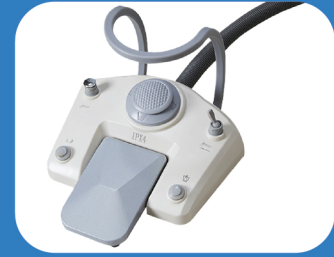
MULTIFUNCTIONAL FOOT PEDAL

إمكانية التحكم في جميع حركات الكرسي وعمل الكأس والمبصقة وفصل المياه والتجفيف .