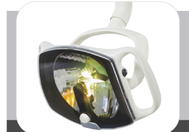
WHITE & YELLOW LIGHT LED LAMP

ضوء ليد أبيض وأصفر : ضوء أقرب إلى اللون الطبيعي إمكانية العمل باللون الأبيض إمكانية العمل باللون الأصفر خلال المعالجة بالكمبوزيت لمنع تصلبها حساس تشغيل باليد , مرونة في الحركة , تركيز عالي