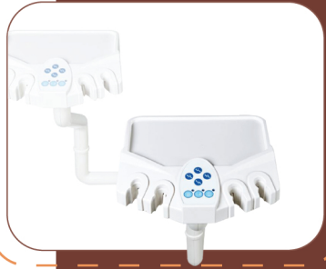
ASSISTANT CONTROL SYSTEM

مع لوحة تحكم متعددة الوظائف ، فمن المريح لمساعد الطبيب استخدام الوظائف المشتركة من كرسي الأسنان ومساعدة أطباء الأسنان لتحسين كفاءة العمل .