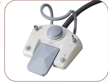
MULTIFUNCTIONAL FOOT PEDAL

إمكانية التحكم في ارتفاع المقعد والمسند عجلات ذات ديمومة طويلة كتيمة للصوت يوفر راحة عالية لجسم الطبيب عند الورك والظهر .