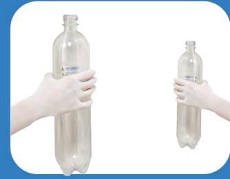
WATER STORAGE BOTTLE

سعة تخزين كبيرة 1.5L توفر وقت عمل أطول لون شفاف لتحديد منسوب الماء داخل الحجلة .