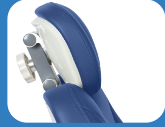
ADJUSTABLE COMFORT HEADREST

مسند الرأس المنحني القابل للتعديل أكثر راحة من مسند الرأس المسطح التقليدي ، فهو يمنع الرأس من الاهتزاز ويمكن تعديله من زوايا متعددة .