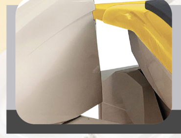
CAST ALUMINUM BOX

يمكن تدويره بزاوية 45 درجة مما يوفر مساحة أكبر لمساعد الطبيب .