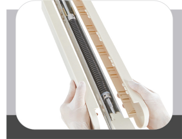
CAST ALUMINUM LAMP HOLDER

مصنوع من ألومنيوم المصبوب ذو المرونة العالية , عمر طويل بعد إجراء أكثر من 100,000 اختبار جهد .