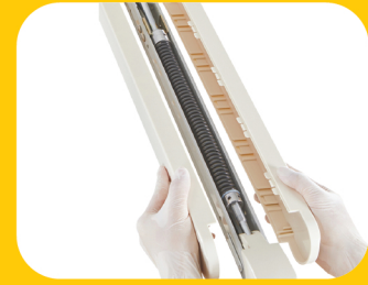
CAST ALUMINUM LAMP HOLDER

مصنوع من ألومنيوم المصبوب ذو المرونة العالية , عمر طويل بعد إجراء أكثر من 100,000 اختبار جهد .