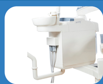
ROTATABLE SIDE BOX

يمكن تدوير الجانب 45° ، والنطاق المتحرك واسع ، ذلك من السهل تحديد الموضع الذي يحتاجه المساعد .