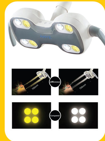
WHITE AND YELLOW LIGHT LED OPERATING LAMP

إضاءة عالية قابلة للتعديل الشدة ( 8000 lux ~ 30.000 ) وألوان أقرب للضوء الطبيعي . 4 ثنائيات باعثة للضوء الأبيض ( ليدات ) 4 ثنائيات باعثة للضوء الأصفر ( ليدات ) إمكانية اختيار لون الضوء مما يوفر راحة في العمل أثناء المعالجة بالكمبوزيت حساس تشغيل باليد عن بعد إمكانية التحكم بدرجة حرارة اللون 5000 K