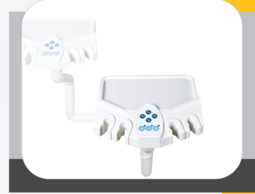
ASSISTANT OPERATING CONTROL SYSTEM

قابلة للحركة بزاوية 45 درجة يميناً ويساراً 7 أزرار للتحكم بوظائف الكرسي ماص جراحي + ماص لعابي