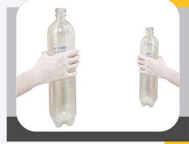
WATER STORAGE BOTTLE

سعة تخزين كبيرة 1.5L توفر وقت عمل أطول لون شفاف لتحديد منسوب الماء داخل الحجلة .