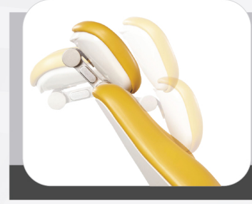
ADJUSTABLE COMFORT HEADREST

مسند الرأس المنحني القابل للتعديل أكثر راحة من مسند الرأس المسطح التقليدي ، فهو يمنع الرأس من الاهتزاز ويمكن تعديله من زوايا متعددة .